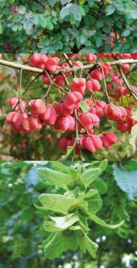
- Wolliger Schneeball - Die Früchte des gemeinen Pfaffenhütchens - Früchte der Hainbuche

Quercus robur (Stieleiche) Rhamnus catharticus (Kreuzdorn) Rosa canina (Hundsrose) Rubus fruticosus (Brombeere) Rubus ideaus (Himbeere) Ribes nigrum (Schw. Johannisbeere) Salix alba (Silberweide) Salix aurita (Ohrweide) Salix caprea (Salweide) Salix cinerea (Grauweide) Salix purpurea (Purpurweide) Salix viminalis (Korbweide) Sambucus nigra (Schw. Hollunder) Sambucus racemosa (Traubenhollunder) Sorbus aucuparia (Eberesche) Tilia cordata (Winterlinde) Tilia platyphyllos (Sommerlinde) Ulmus glabra (Bergulme) Ulmus minor (Feldulme) Viburnum opulus (Gem. Schneeball)