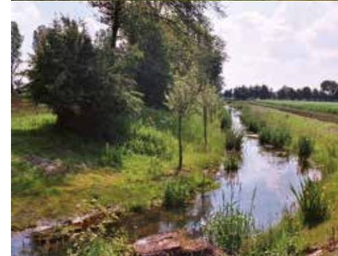
- Feuchtbiotop im Artland - Renaturierung Altgewässer Glandorf