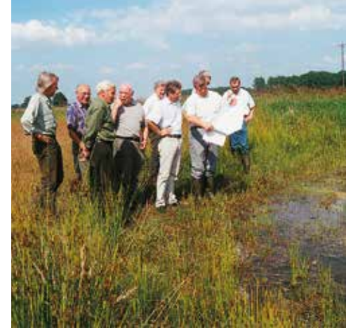
- Erörterung eines Förderantrages vor Ort

Information und Beratung wird groß geschrieben. Ob bei Problemen mit Wespen, Hummeln und Hornissen oder bei der Formulierung von Förderanträgen.