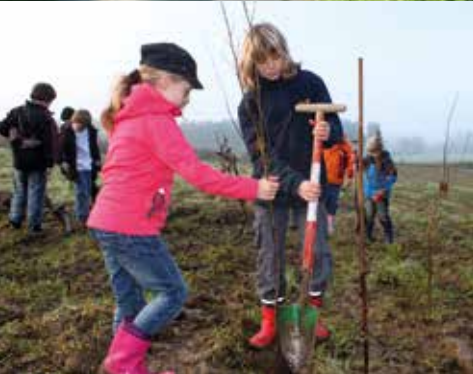
- Allee in Melle - Schulklasse bei einer Klimawald-Pflanzaktion

Der Landkreis Osnabrück und die Naturschutzstiftung des Landkreises Osnabrück fördern im Rahmen des Landschaftspflege-Förderprogramms und im Rahmen der verfügbaren Haushaltsmittel seit über 25 Jahren die Anlage von Biotopen, die dem Erhalt der Kulturlandschaft, der Verbesserung des Landschaftsbildes und der Erhöhung der Leistungsfähigkeit des Naturhaushaltes dienen.