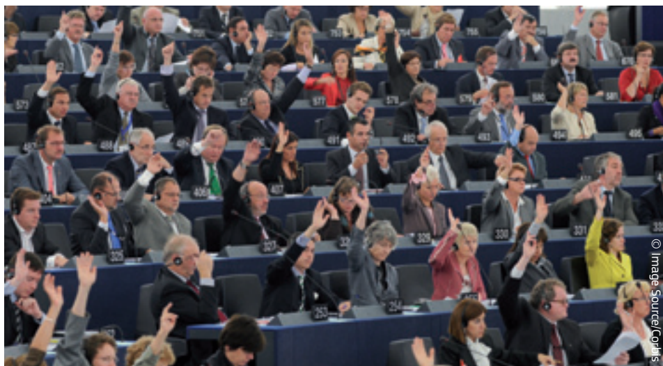
Das Europäische Parlament – hier können Sie sich Gehör verschaffen.

Im Jahr 2011 wurde der Deutsche Martin Schulz (Progressive Allianz der Sozialisten und Demokraten) zum Präsidenten des Europäischen Parlaments gewählt.