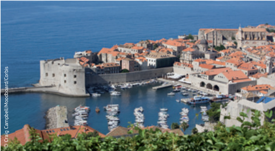
Dubrovnik, die „Perle der Adria“ in Kroatien, dem jüngsten Mitgliedstaat der EU