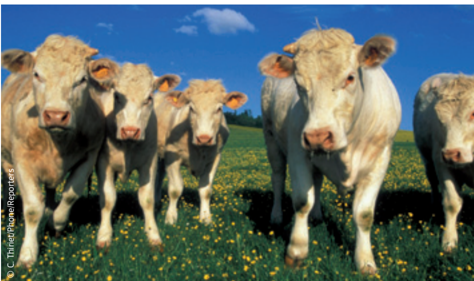
Die Landwirtschaft muss sichere und hochwertige Lebensmittel liefern.

Die Europäische Kommission vertritt die EU bei internationalen Verhandlungen in der Welthandelsorganisation (WTO). Die EU will erreichen, dass die WTO mehr Wert auf die Lebensmittelqualität,