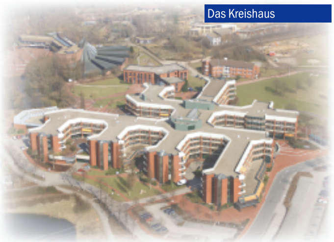
Zu erreichen mit der Stadtbuslinie 21 vom Hauptbahnhof Osnabrück, Haltestelle Kreishaus/Zoo