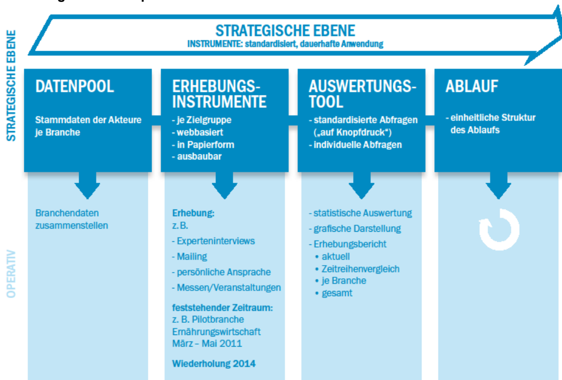
Abb. 2: Strategische und operative Ebene

© Landkreis Osnabrück, Arbeitsmarktmonitoring