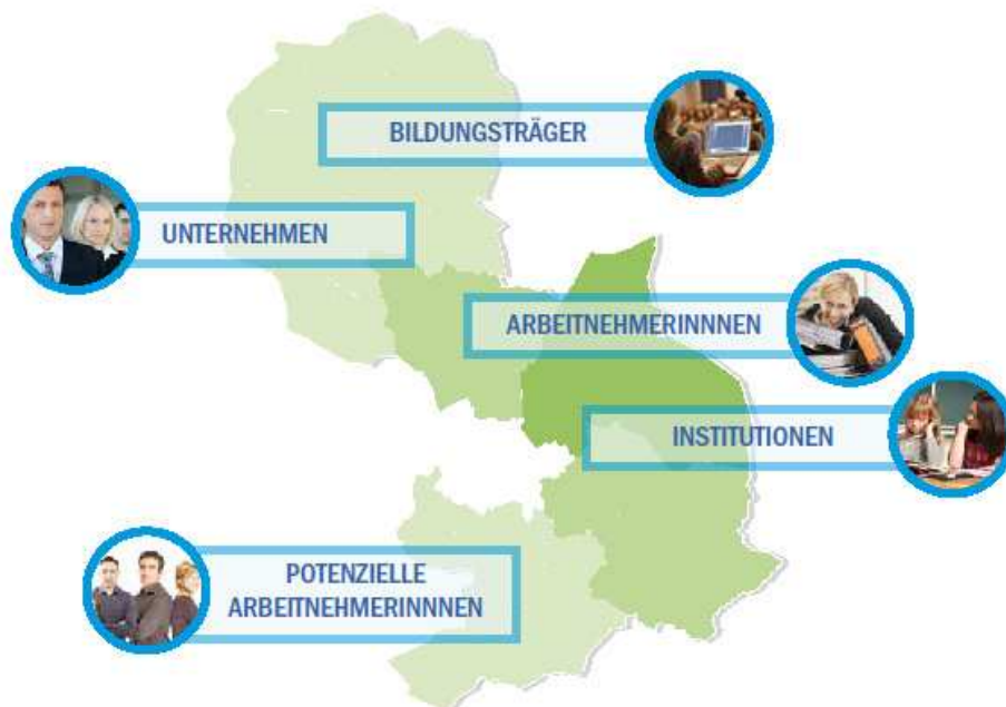
Abb. 1: Zielgruppen der Erhebung

Die Informationsbedarfe aller Zielgruppen werden aufgenommen. Gleichzeitig soll mehr Transparenz über die entsprechenden Aktivitäten und Angebote im Landkreis erreicht werden. Die Schaffung und Nutzung von Synergieeffekten durch die Zusammenarbeit mit den Akteuren am Arbeitsmarkt sind gewollt und sollen vorangetrieben werden.