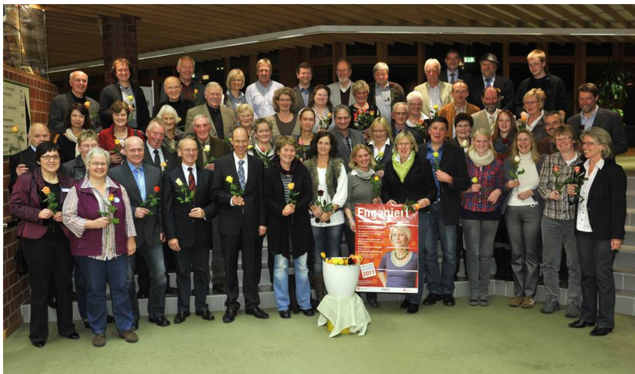
Foto unten: Sie treten ein für ehrenamtliches Engagement: Die Teilnehmer am Wettbewerb „Unbezahlbar und freiwillig“ aus dem Osnabrücker Land waren im Kreishaus zu Gast.

Weitere Infos zum Wettbewerb finden Sie unter www.unbezahlbarundfreiwillig.de